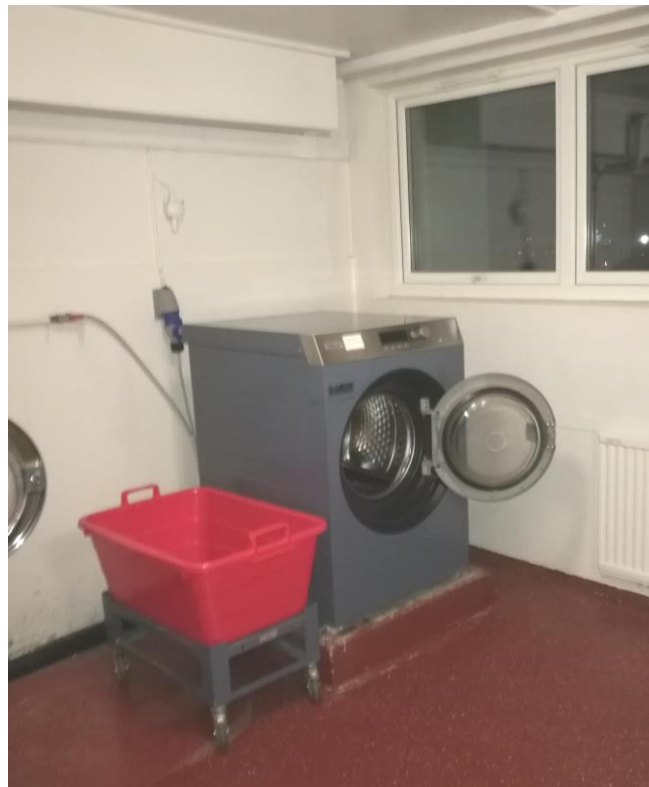
Stenging av vaskeriet ser ut til å ha hatt virkning. Styret har ikke mottatt flere klager

Dette ble gjort for å sette fokus på det manglende renholdet og viktigheten av at ALLE vasker etter seg. I disse Corona-tider er renhold viktigere enn noen gang.