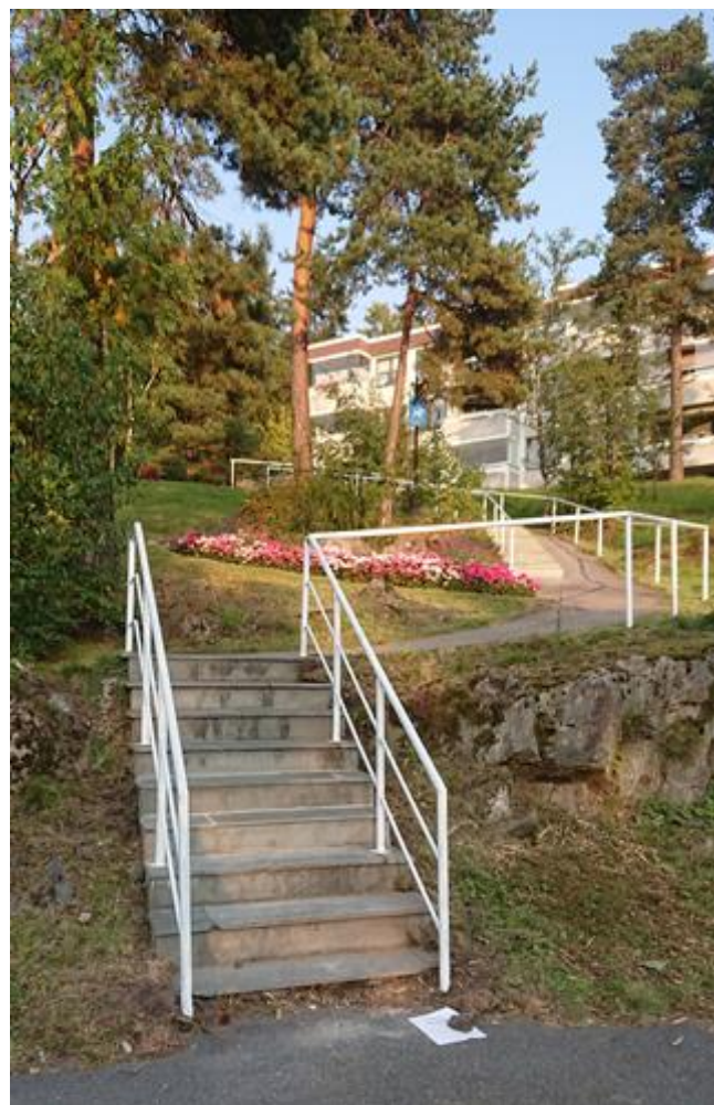
Trappa er klar for vinteren

Senere ble rekkverket påført et par lag med grønn maling, slik vi kjenner det fra tidligere.