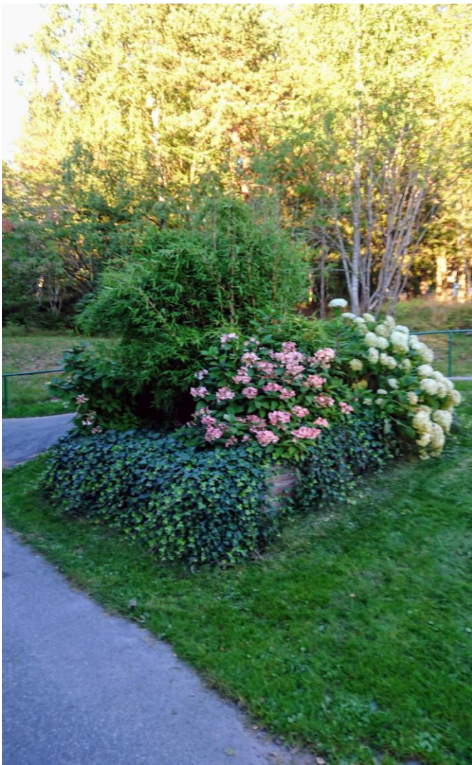
Bare et bilde fra tidlig i september, blomsterkasse i Kv. 27 som er så fantastisk fin.