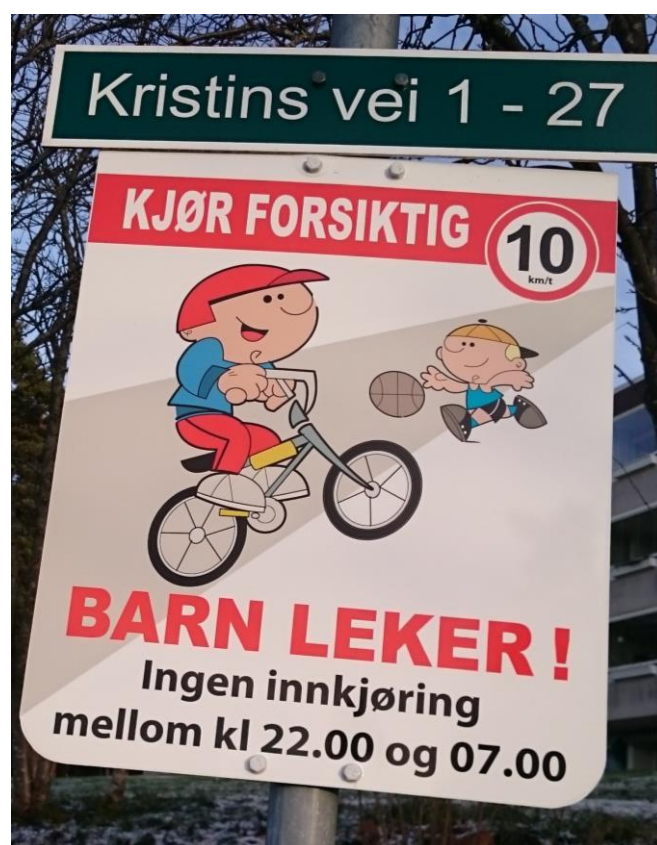
Det er satt opp nye skilt ved alle innkjøringene

Styret mottar mange klager, både over unødvendig kjøring og for stor hastighet på stikkveiene.