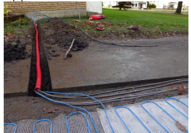
Asfalten fjernes, varmekablene legges på en seng av sand og plastmatte, før det asfalteres over.

De 2 siste varmekablene på gangveiene er ferdige og tatt i bruk. I begge tilfelle dreier det seg om forlengelser av eksisterende kabler. Den ene går fra Kristins vei 37 og ned til nr 7, mens den andre går fra Kristins vei 25 og ned til p-plassen.