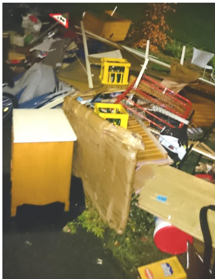
Slik så det ut utenfor oppgangene

Tirsdag kveld ble hele Kristins vei ryddet. Dagen etter var turen kommet til Erlends vei. Forholden her var de samme.