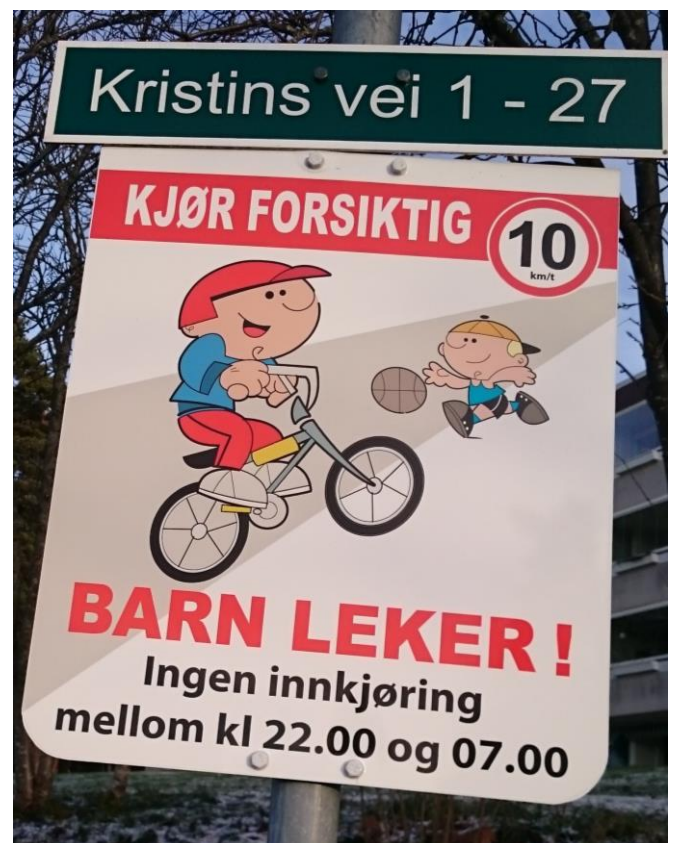
Det er satt opp nye skilt ved alle innkjøringene

Styret mottar mange klager, både over unødvendig kjøring og for stor hastighet på stikkveiene.