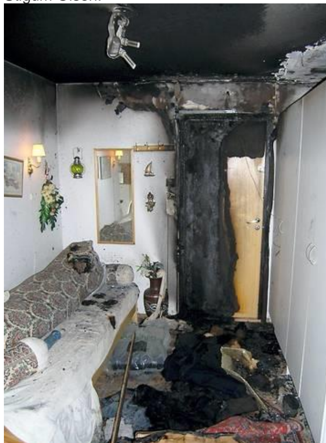
Lampen i taket var ikke montert etter forskriftene. Resultatet ble brann. (Bildet er ikke fra Lohøgda).

Er det tilfellet, kan man få en meget betydelig avkortning av erstatningsbeløpet, forteller Stigum Olsen.