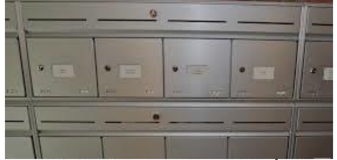
Gule lapper på postkassene vil bli fjernet. Å skrive med tusj er hærverk.

Styret oppfordrer alle til å benytte tilbudet slik at postkasser og tablå har riktig navn til enhver tid.