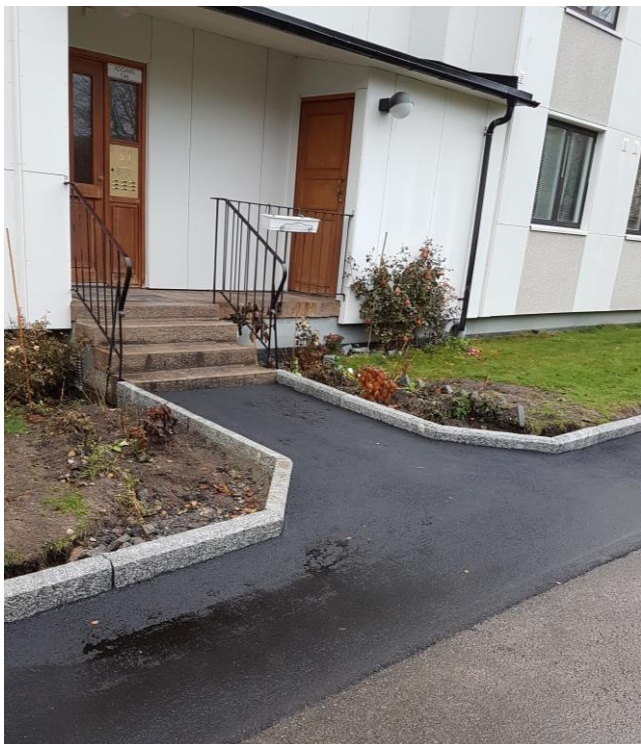
Slik blir resultatet – bildet er fra Kristins vei

Den siste asfalten blir lagt i slutten av september, deretter følger påfylling av jord og tilsåing.